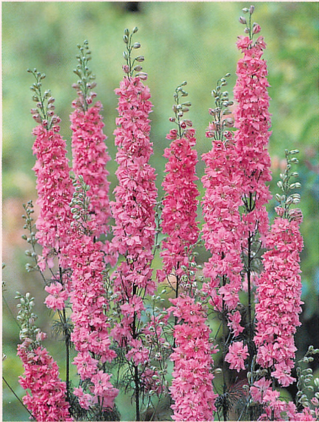
マーベラス ピンク