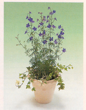
ブルースイングのポット仕立て